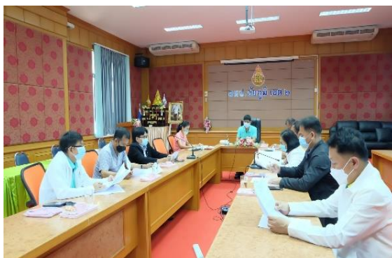
ภาพ : การประชุมจัดเรียงลำดับความจำเป็นเร่งด่วน ในการขอรับการสนับสนุนอุปกรณ์ DLTV ปี 2565-2567